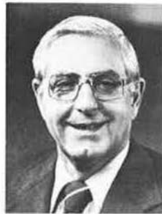
Victor Atiyeh Governor