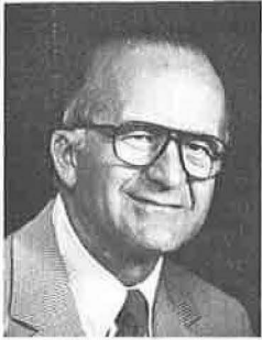
Ken Jernstedt State Senator

한국에 파견하는 Atiyeh 주지사 무역사절단에 합류하게 된것을 영광으로 생각합니다. 이번 사절단을 통하여 국제무역과 한국 Iowa주 양국의 아이디어와 기술을 교환하고 양국시민들을 더욱 친밀하게 하는 노력을 함으로써 우리는 더욱 새로운 협력의 방안을 발견할 수 있으리라 희망합니다.